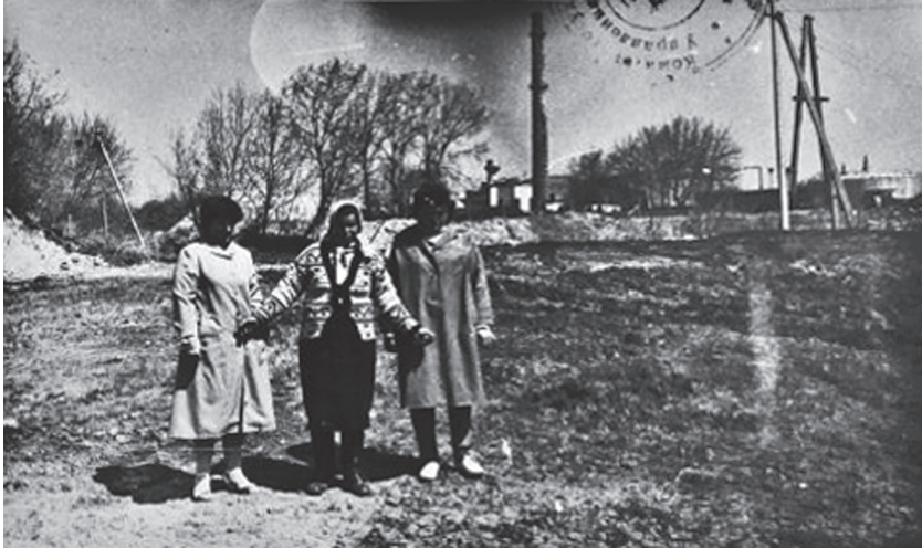
Під час огляду території у квітні 1988 р. свідок показує місце, де розстріляли ромів. During a site inspection in April 1988 an eyewitness points out the spot where the shootings of Roma took place.