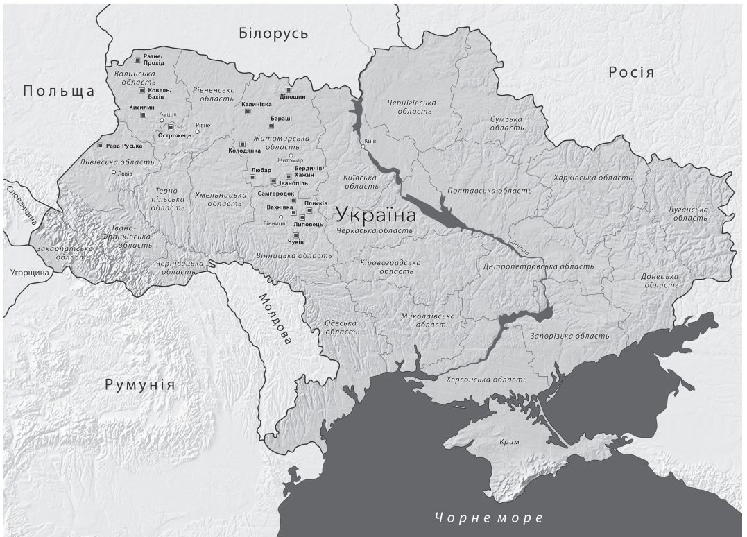
Місця проекту «Захистимо пам'ять»

У період німецької окупації 1941–1944 років на території сучасної України під час масових розстрілів було вбито понад мільйон євреїв та понад 12 тисяч ромів. На території сучасної України знаходяться понад дві тисячі місць масових розстрілів. У віддалених ярах, лісах, посеред полів, у колишніх протитанкових ровах чи піща-