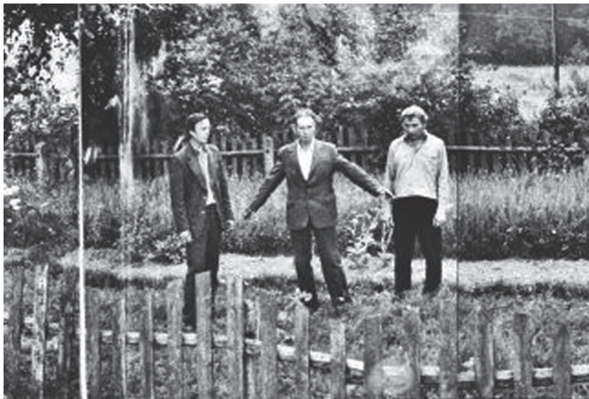
Єврейське масове поховання у серпні 1987 р. до ексгумації жертв.

The Jewish mass grave in August 1987 before the exhumation of the victims.