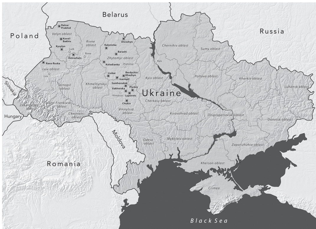
Map of the “Protecting Memory” project sites

During the German occupation, from 1941 to 1944, over one million Jews and more than 12 thousand Roma were murdered and hastily buried in mass shooting operations throughout the territory of what is today Ukraine. Estimates suggest there more than 2,000 mass shooting sites on the territory of contemporary Ukraine. In remote ra-